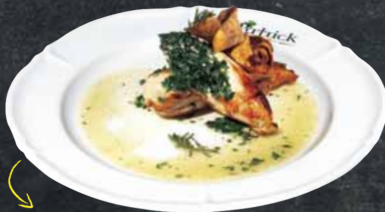
878 Zprudka grilovaný KURECÍ PRSNÍ STEAK provoněný čerstvým rozmarýnem s bylinkovou omáčkou a celerovými chipsy, 200g 229,- Kč