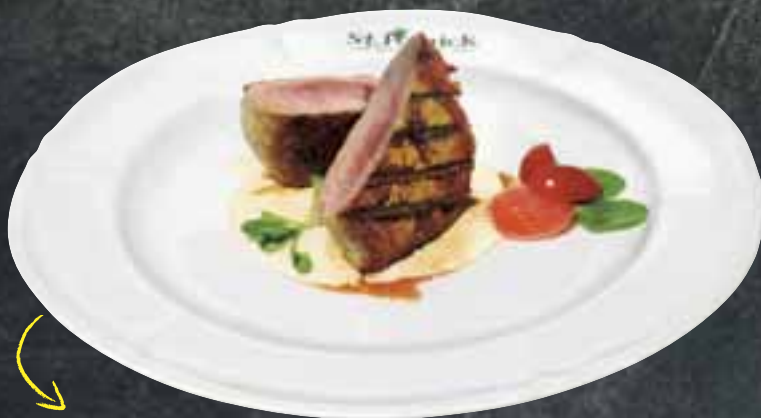
877 Vepřová PANENKA NA GRILU "OFFALY" přelitá jemnou sýrovo-smetanovou omáčkou, 200g 249,- Kč