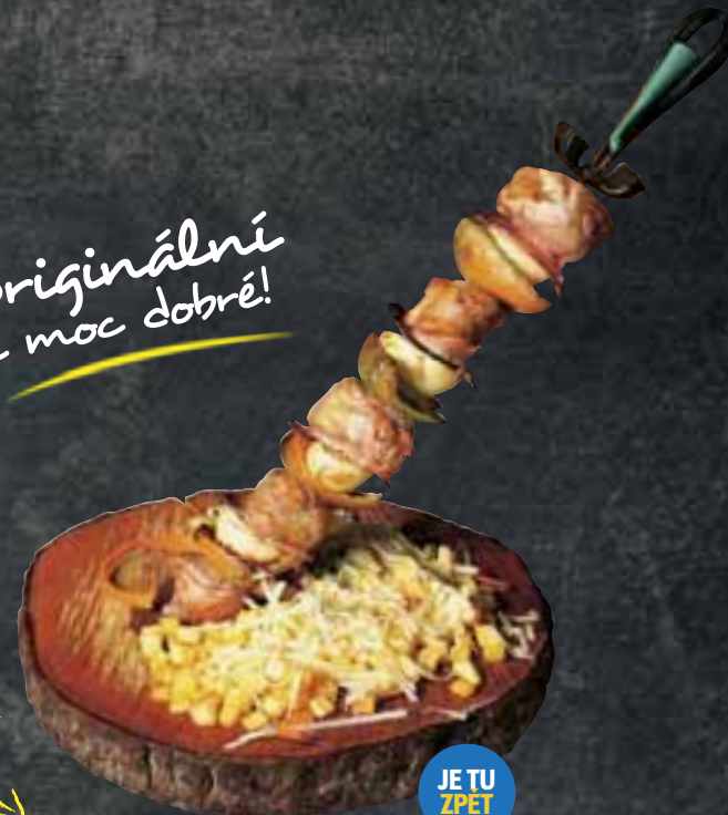
903 MEČ SLIGO jemně marinované masíčko z vepřové panenské svíčkové, prokládané cibulí, slaninou a paprikou, servírované s bramborovými kostičkami se sýrem a česnekem 329,- Kč