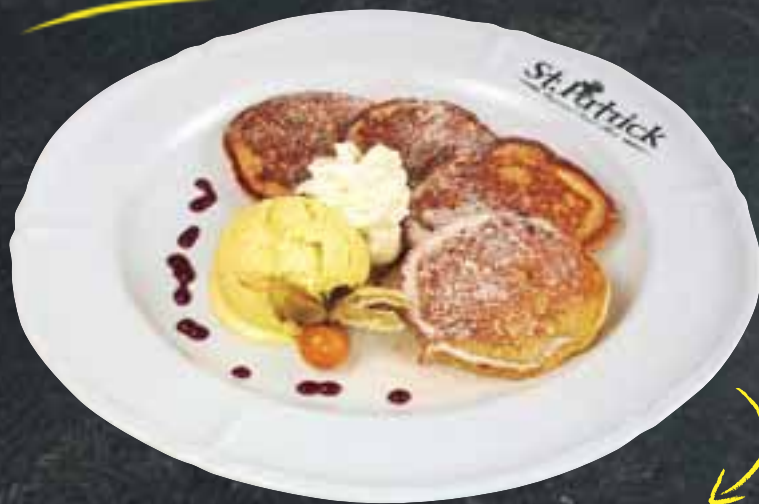
940 Naše kynuté LÍVANEČKY s vanilkovou zmrzlinou a borůvkovým pyré 129,- Kč